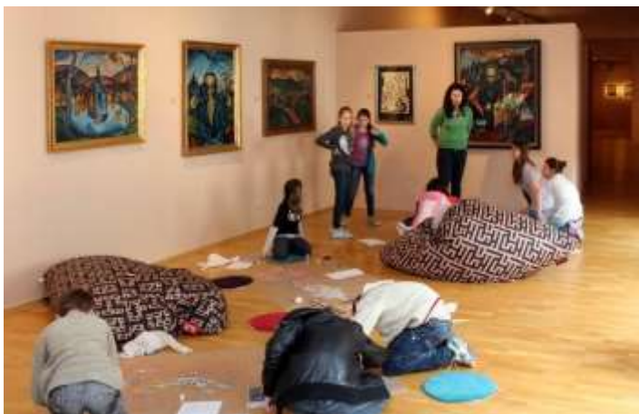
Animačný program k výstave Košická moderna