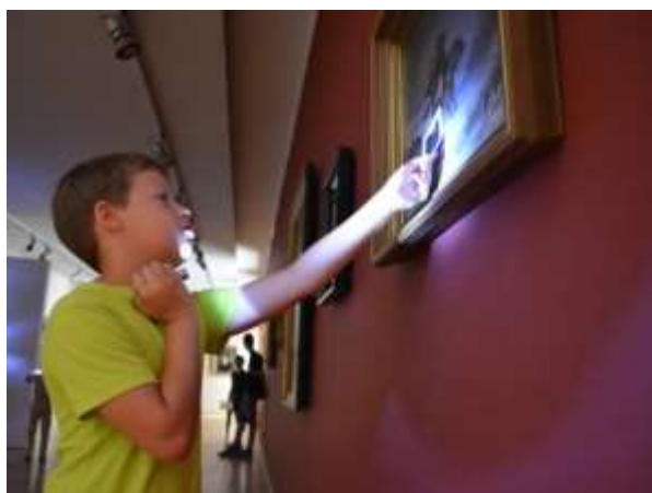
Workshop k výstave 19. storočie zo zbierok VSG