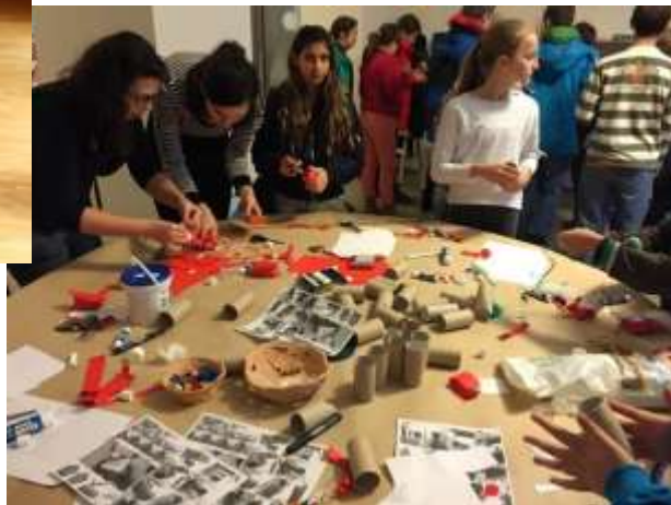
Vianočné tvorivé dielne