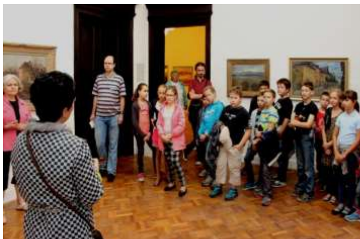
Komentovaná prehliadka k výstave Fabini