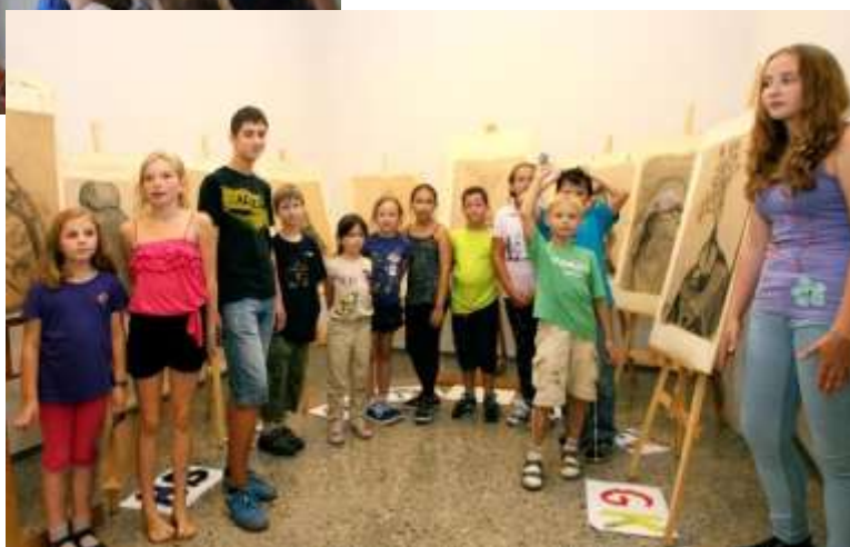
Vernisáž Kreatívneho tábora