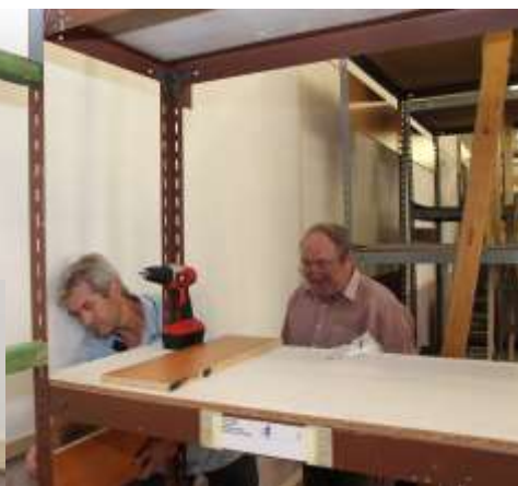
Havarijný stav – Hlavná 27: