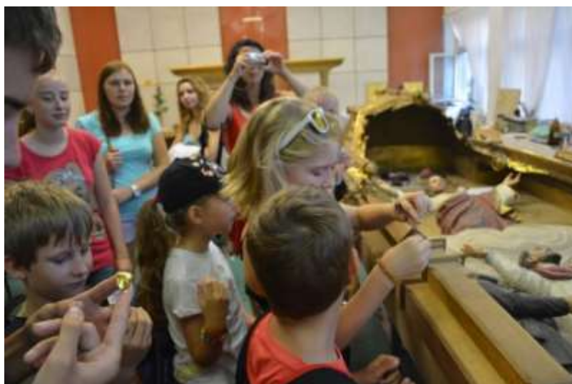
V reštaurátorských dielňach združenia Villard Košice.