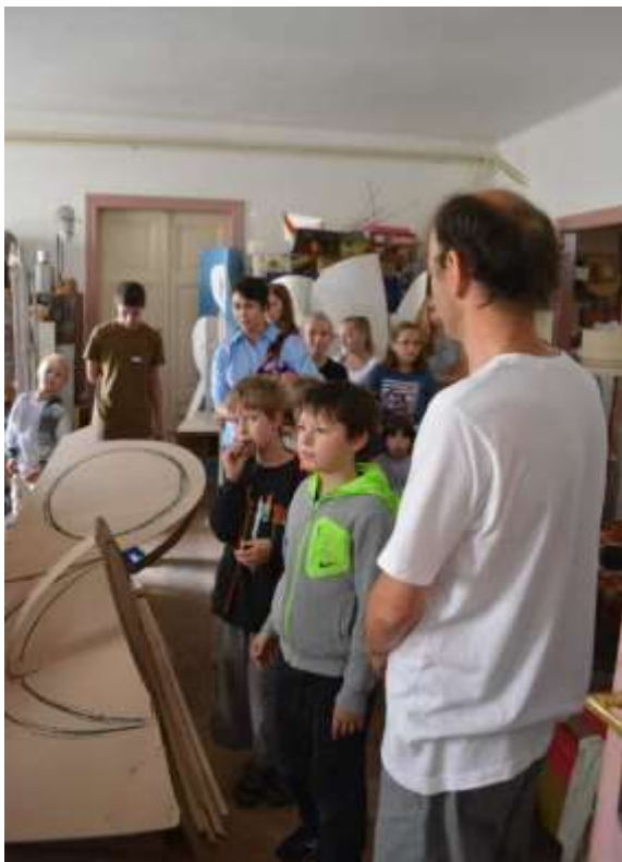
Na výstave SNP v Kunsthalle.