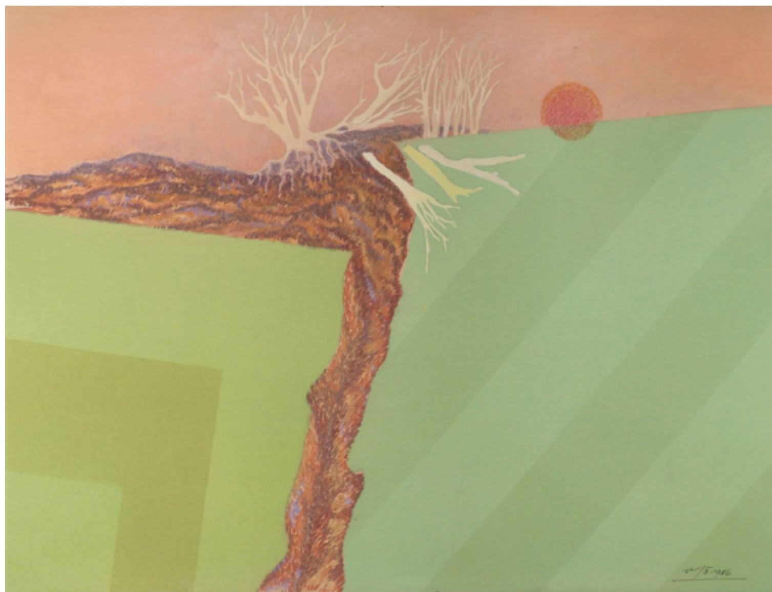
Krajina nového typu , 1986, tempera, pastel, papier, Šarišská galéria Landscape of a New Kind , 1986, tempera, pastel, paper, Šariš Gallery