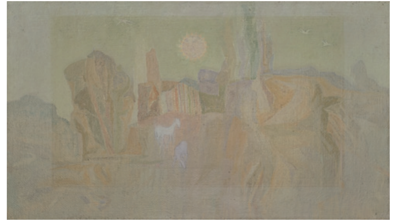
Krajina, na ktorú zabúdam , 1973, kombinovaná technika, plátno, súkromný majetok The Landscape I Am Forgetting , 1973, combined technique, canvas, private property