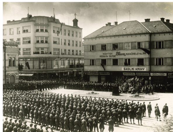
2 Užhorod: Smútočná trýzna za T. G. Masaryka.

Poznámka k tabuľkám 1 a 2: údaje k roku 1910 sa viažu na sčítanie kategóriu najčastejšie hovorený jazyk, údaje z rokov 1921 a 1930 sa viažu na sčítanie kategóriu národnosť. Židovská národnosť bola zavedená až v československých sčítaniach ľudu v rokoch 1921 a 1930. Počet vyznávačov judaizmu v Košiciach v roku 1910 bol 6 729 (15,20 %) a v Užhorode 5 305 (31,35 %). V československých sčítaniach ľudu v rokoch 1921 a 1930 sa zisťovala ruská a maloruská národnosť, pričom sa tu započítavali Rusi a Rusíni ruskej, ukrajinskej i rusínskej autochtónnej orientácie.