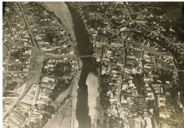
3 Užhorod: letecký záber na mesto, 1923, pozitív.